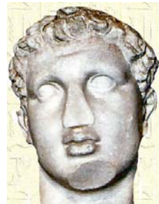
Ptolémée IV Philopator